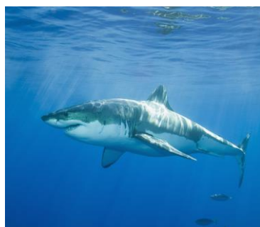
Obr. 5: Žralok