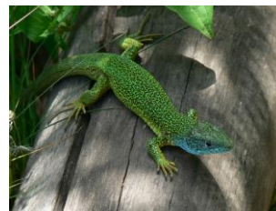
Obr. 8: Ještěrka zelená