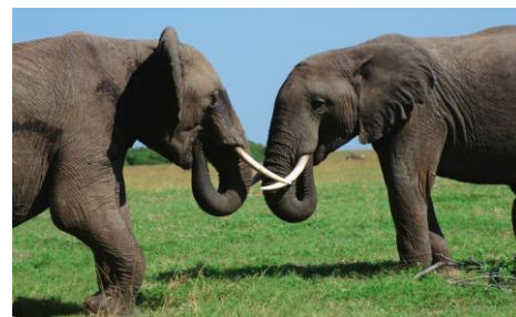
Obr. 3: Sloni