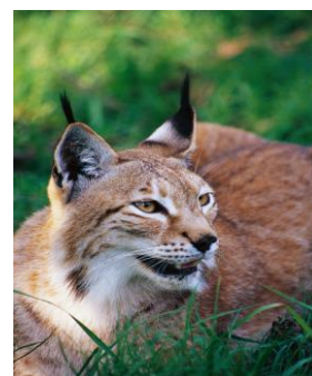
Obr. 6: Rys

! Lidé ničí životní prostředí zvířat - kácení lesy, vysoušení mokřiny, stavění dálnice, vypouštění chemické látky do přírody !