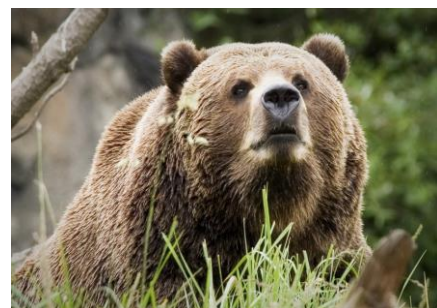
Obr. 1: Medvěd