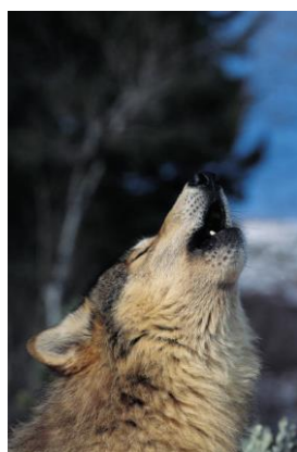
Obr. 2: Vlk